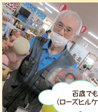
百歳でもビール (ローズヒルケアセンター)