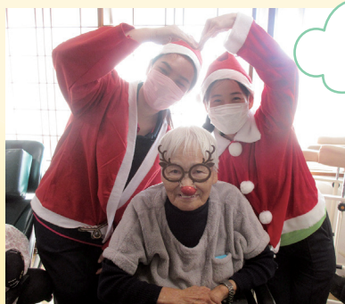
笑顔でお喋り。 楽しい一時。 (ローズヒル)