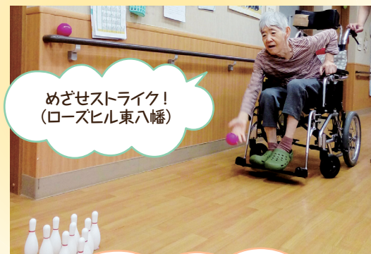
めざせストライク！ (ローズヒル東八幡)