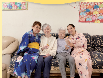
いつも笑顔で頑張っています。