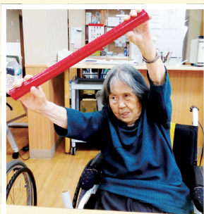
ローズヒル東八幡