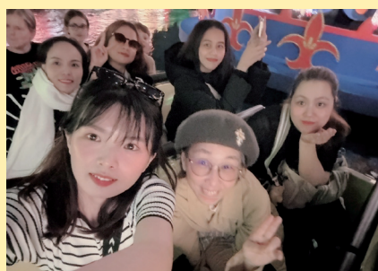
職員と一緒にディズニーランドの休日♪

早いもので創立 50 周年から 1 年が経ち、法人がいかに地域の皆様に支えられ、且つ福祉分野の最前線として長い間走り続けて来たのかを改めて実感した年でした。今後も感染症対策を続けながらにはなりますが、ご利用者様の笑顔の為に日々邁進していく所存です。これからも皆様に愛され親しまれる紙面づくりを目指し、励んでまいりたいと思います。 広報委員一同