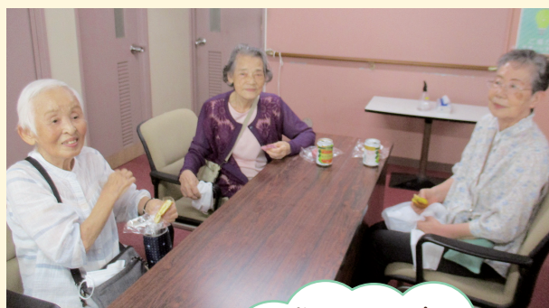
ボランティアの方の指導の下、イス作り中！ (つちやホーム)