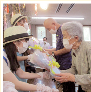
ローズヒルケアセンター