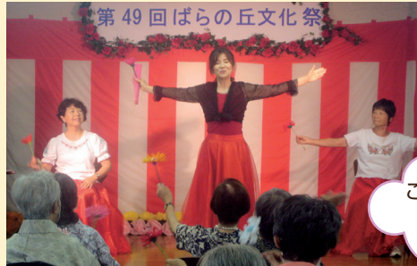
ご家族様も参加された 3年ぶりの納涼祭 (つちやホーム)