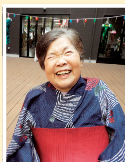
ローズヒル東八幡