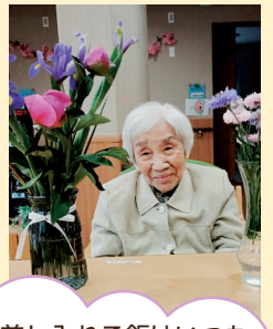
ご家族差し入れご飯はいつも と違ってたまにはいいですね (ローズヒル東八幡)