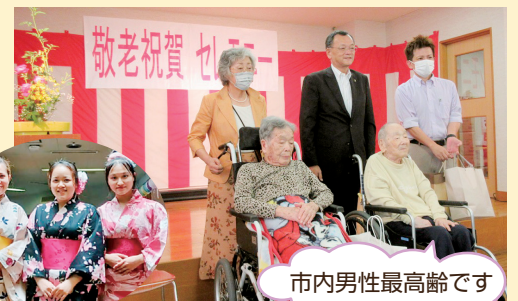
市内男性最高齢です