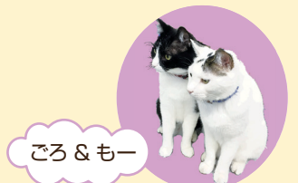
ごろ & もー