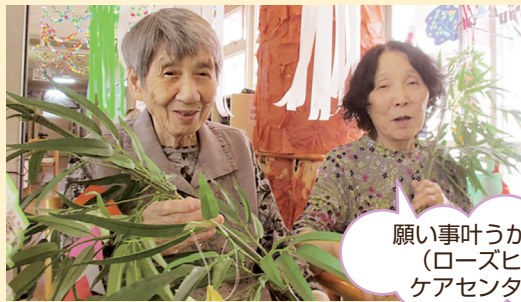
願い事叶うかな… (ローズヒル ケアセンター)