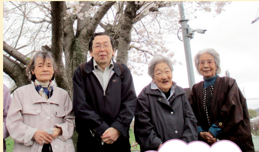
ご夫婦だけの 大切な時間です (ローズヒル)