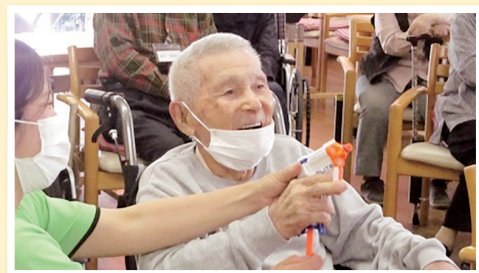
ローズヒルケアセンター